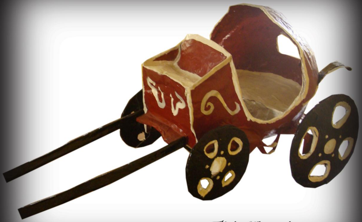
Título: El papel y yo.