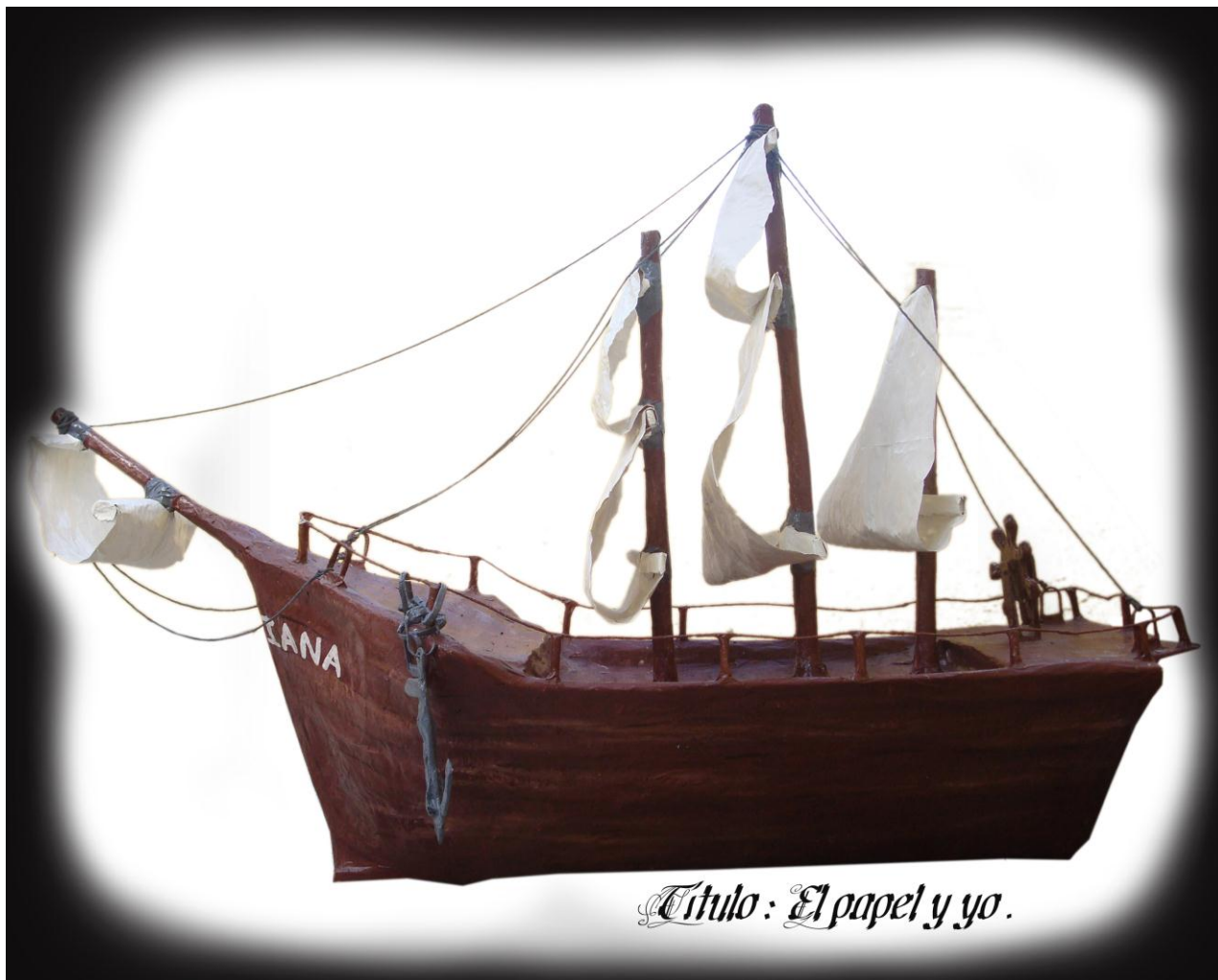
Título: El papel y yo.