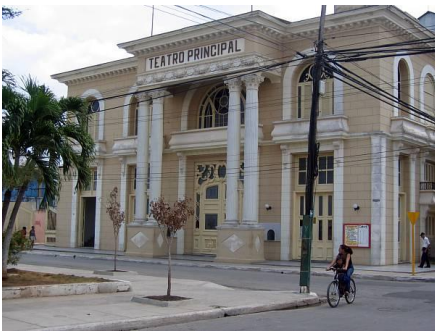
-Teatro de Ciego de Ávila