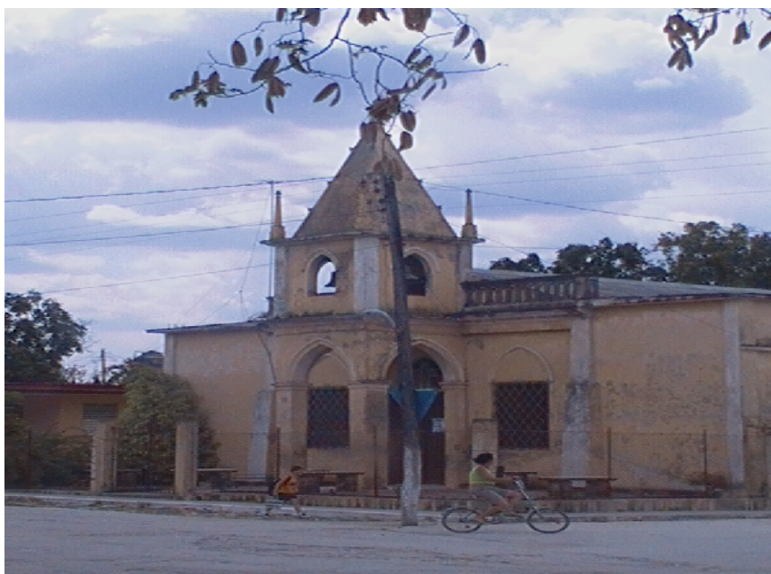
Iglesia Católica de Guayos.