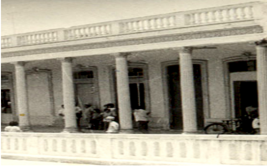
Café “Río Frío”, también conocido como refresquera de Leandro.