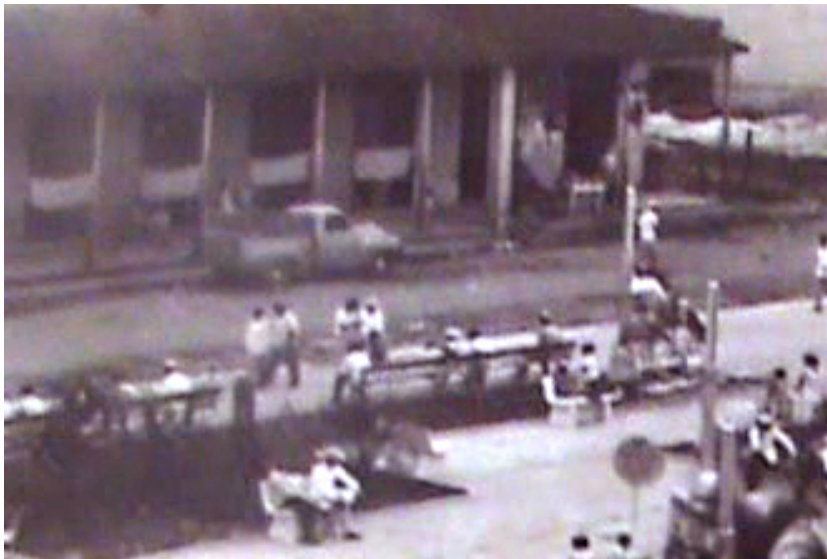
Primer cine teatro “Alcázar”.