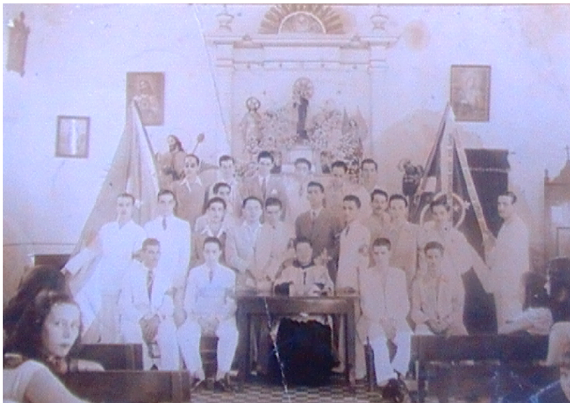
Miembros del Cuadro de declamación local, en la Iglesia católica de Guayos, junto al sacerdote, después de haber interpretado ¡María, madre mía! (Obra de pequeño formato escrita por Aldo Mendoza).