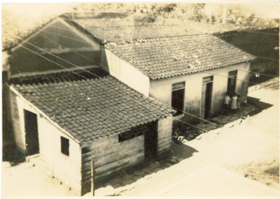
Imprenta de Wilfredo.