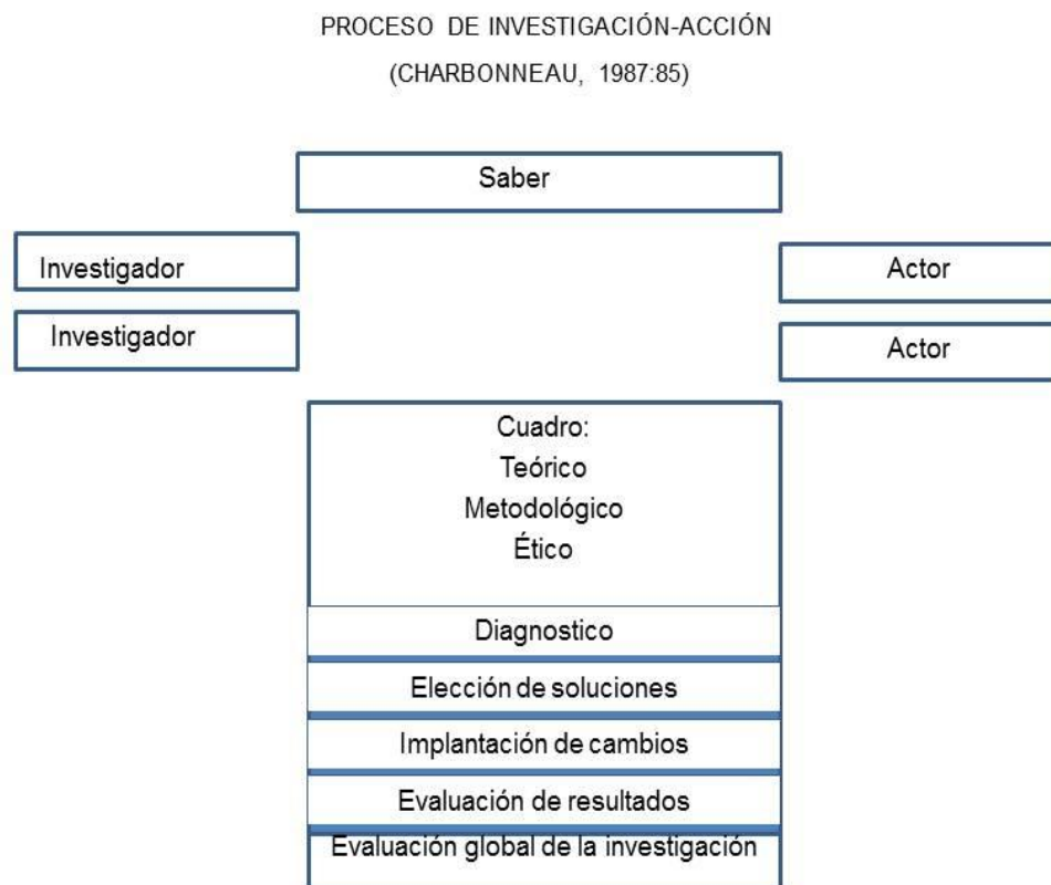
Figura 2.1. Proceso de la investigación-acción (Charbonneau, citado por Rusque, A. (1999:202)

La concepción de la investigación-acción se sistematiza a lo largo de la investigación, a partir del diagrama propuesto por Charbonneau y asumido por Rusque, A. (1999:202) donde se caracteriza (Fig. 2.1), que permite el diseño e implementación de la estrategia de aprendizaje.