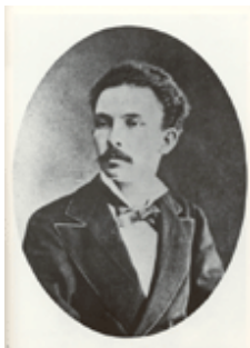
Martí en México, 1875