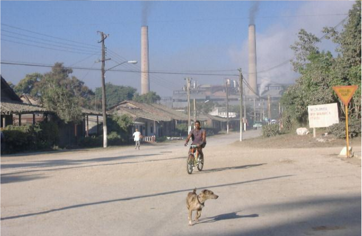
Imágenes del central de Tuinucú