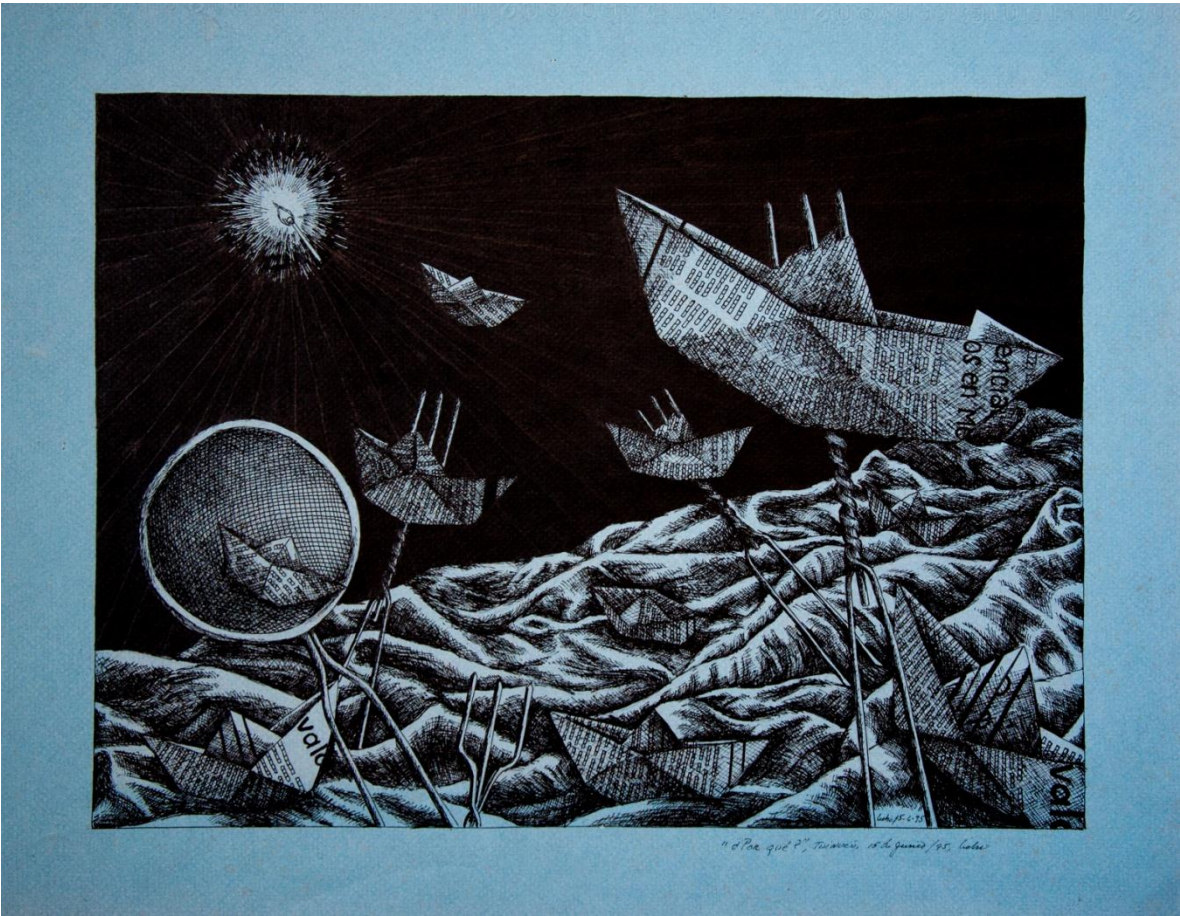
Fig.4 Por qué