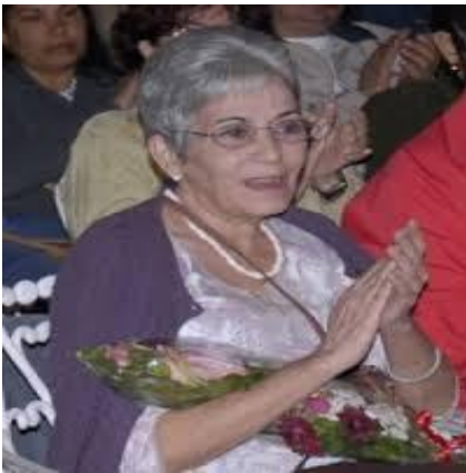
En un homenaje por su labor artística.