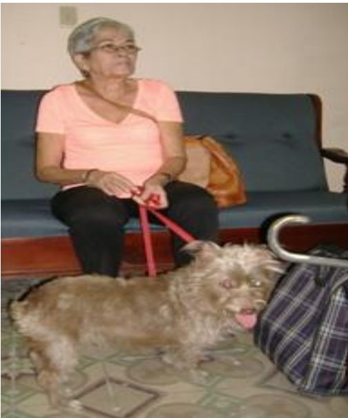
Acompañada de su perrita Lili Marlén en la UNEAC