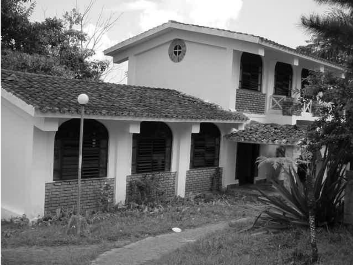
Albergue 2.jpg De la Fame