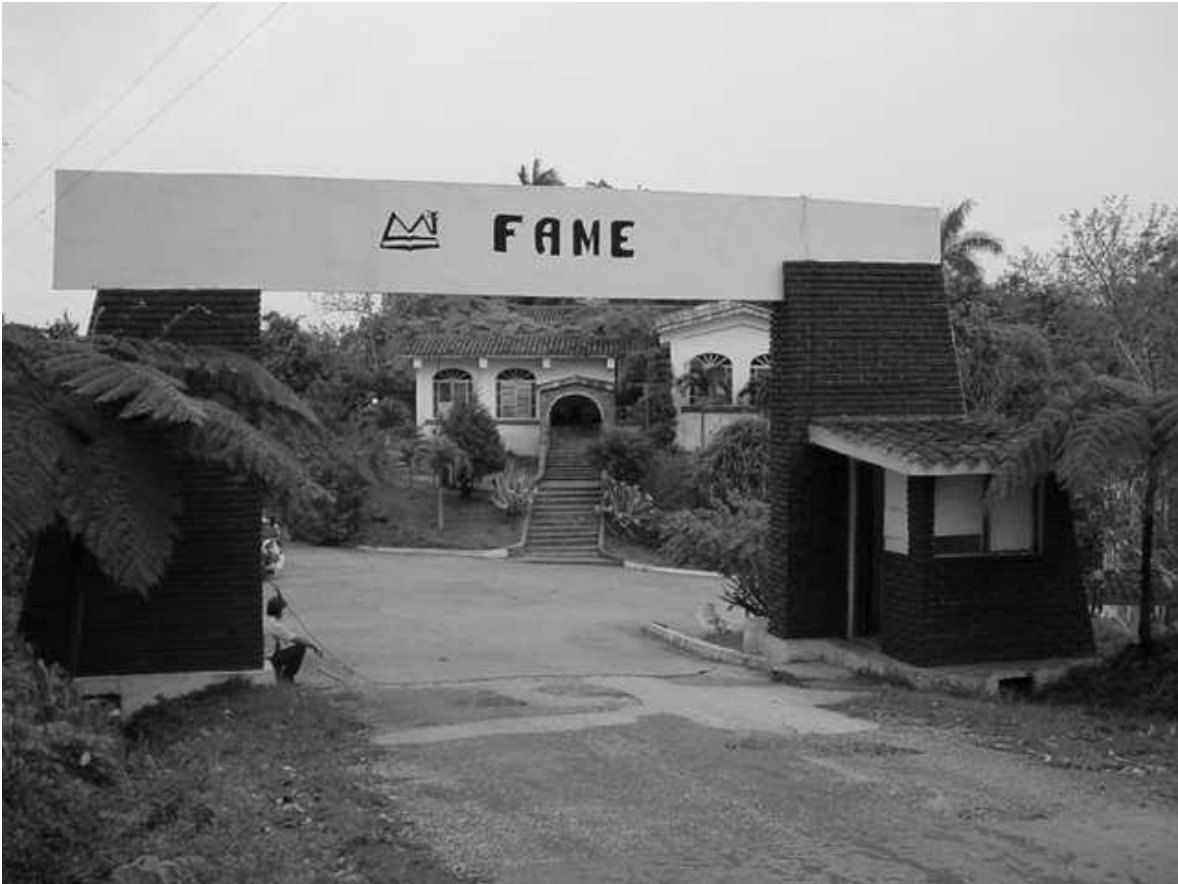
Entrada de la Fame.jpg