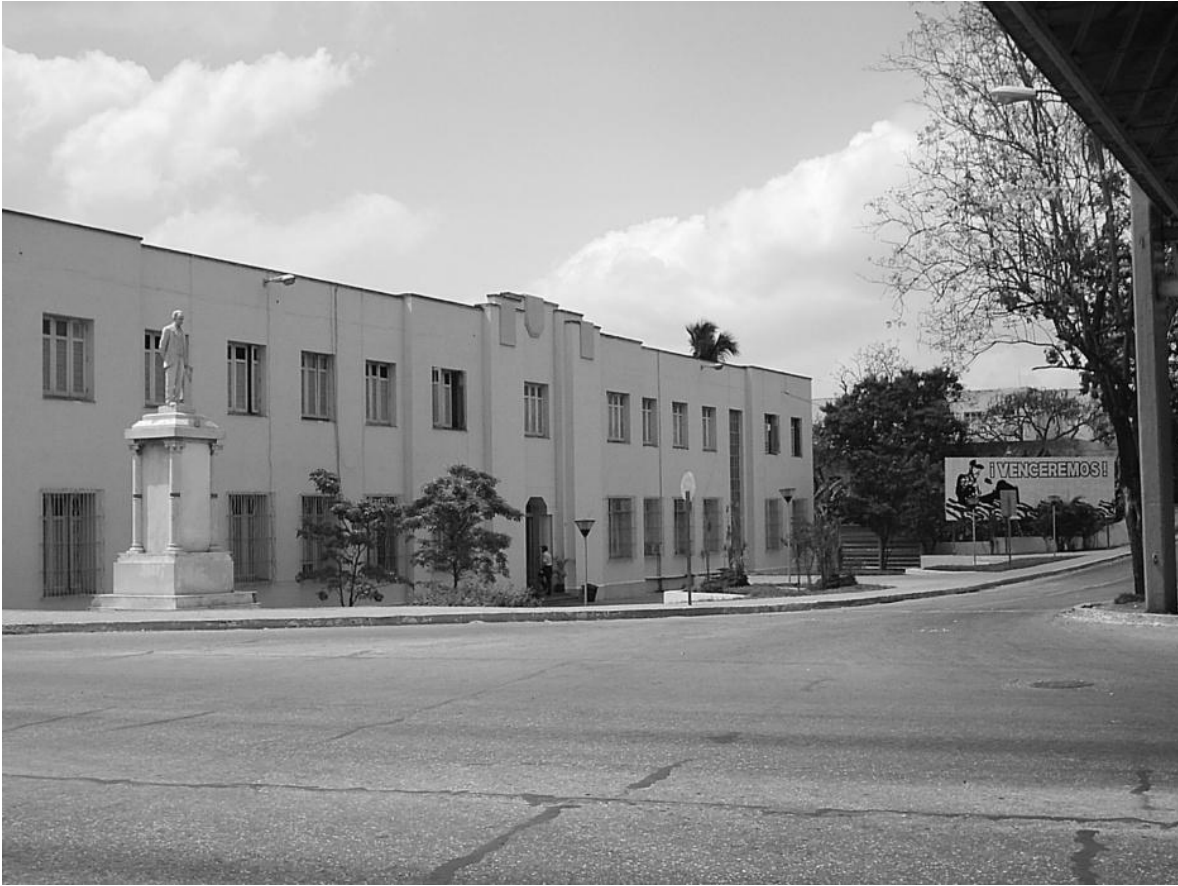
Vista Actual de la Universidad de Santi Spiritus "José Martí Pérez"