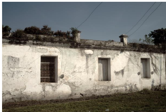
Barracón de esclavos construido entre 1860 y 1873.

Cuando se construyó el central se necesitaban trabajadores para las labores, tanto agrícolas como industriales y se recurrió a la trata de esclavos africanos que estaba en plena vigencia. De esta forma se compraron las dotaciones que debían ser explotadas y maltratadas por el dueño y los mayores de la industria. Con la dotación de esclavos se construyó el edificio.