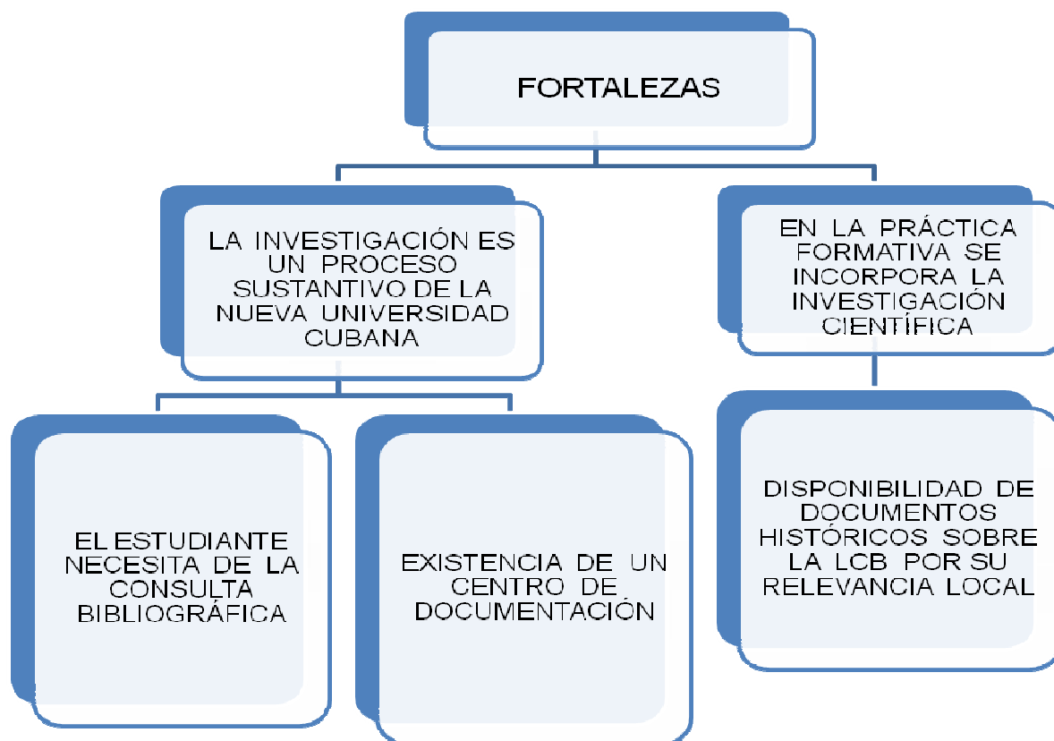
Fig. 2. Fortalezas

Durante los estudios universitarios, en las carreras directamente adscritas al Ministerio de Educación Superior, por citar un ejemplo, los estudiantes cumplen como promedio unos 8 trabajos científicos de este tipo, denominados trabajos de curso. De tal modo, resulta usual que en las universidades cubanas, al referirse a este tipo de actividad formativa, se acostumbre a utilizar el término investigativo-laboral. Para desarrollar sus trabajos investigativos el estudiante tiene que apoyarse en documentos, en bibliografías que orienta el profesor en las clases