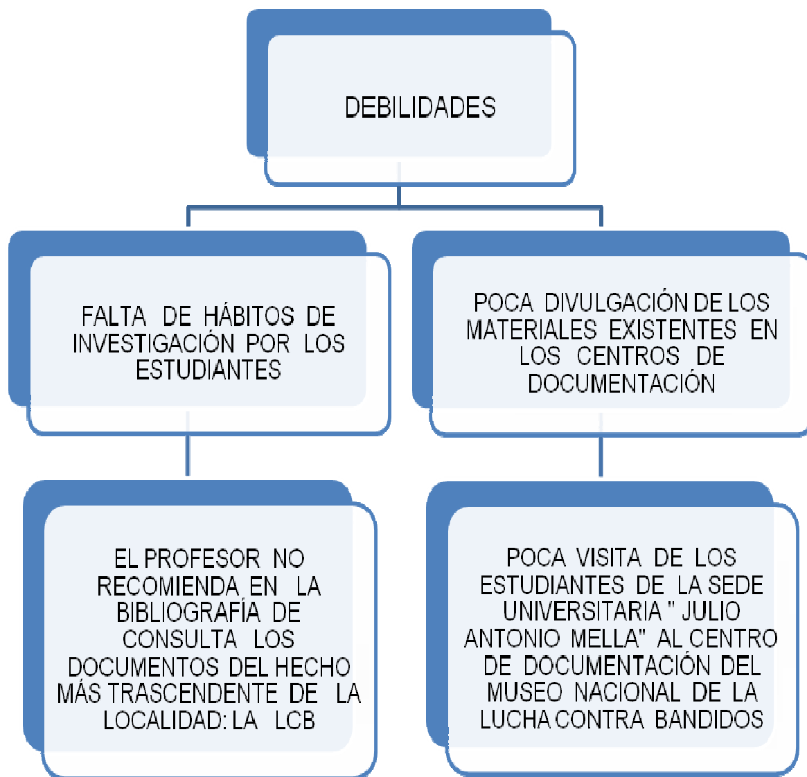
Fig. 1. Debilidades