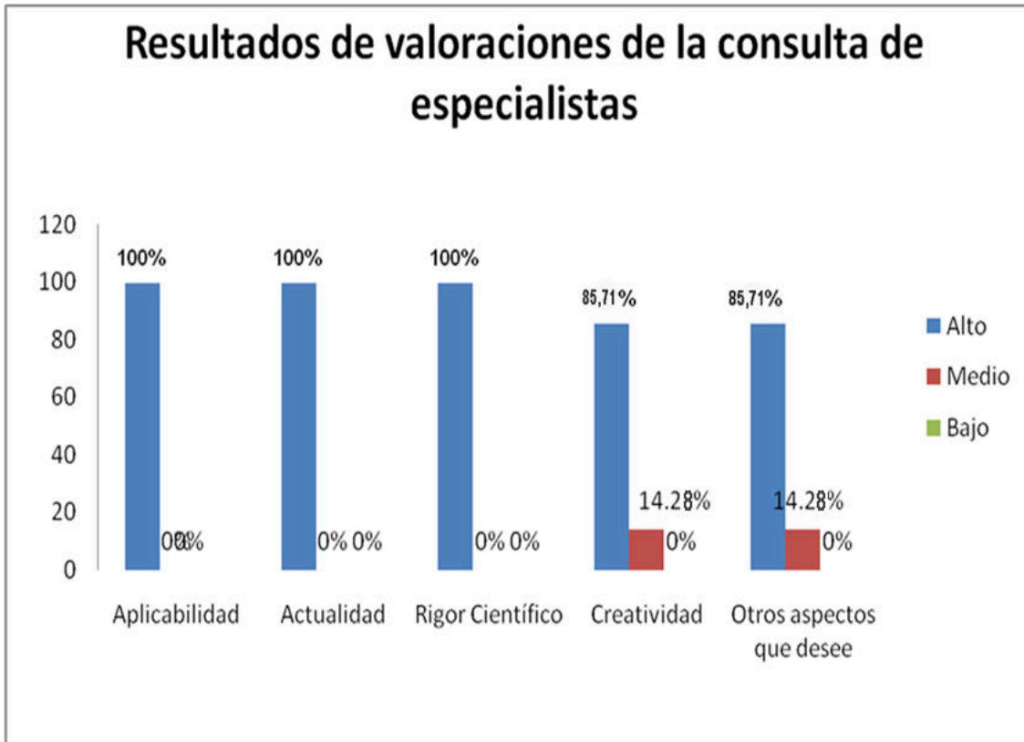
Gráfico de resultados de las valoraciones de los especialistas