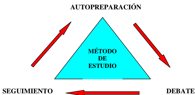
Esquema N. 1 Enfoque de autopreparación de la Escuela Superior del Partido Comunista de Cuba (PCC).

La vía fundamental que se utiliza para aplicar las acciones es el nuevo enfoque de la Escuela Superior del Partido Níco López, (Enfoque Níco López) el cual se puede sintetizar en el siguiente esquema: