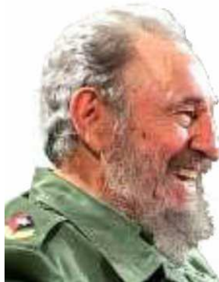
Fidel Castro Ruz. 4/9/78.

“Entonces lo más importante para nosotros ha empezado a ser ya, desde hace muchos años, la calidad de la enseñanza. Pero la calidad de la enseñanza va a depender fundamentalmente de la preparación del personal docente...”