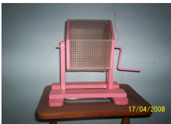
Foto de biombo

Las familias al seleccionar una tarjeta solo alcanzarán la mitad del logro o una parte de este. Luego, cada participante debe buscar a su "par" para completar la figura, al encontrarlo se realiza la lectura comentada del logro escogido. Se abre el debate y la reflexión sobre este analizándolo.